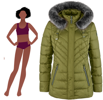
Webpelzdetails oben, definierte Taille & Stepp: die Steppjacke Ultraleicht ist perfekt für große

Setzen Sie auf Muster und Zierelemente. Denn große Frauen profitieren besonders von einer optischen Unterteilung ihrer Schnittführung. „Merkmale wie Teilungsnähte, querbetonte Karomuster oder Taillengürtel verkürzen die Figur“, sagt die Stil-Expertin. Abstand nehmen sollte man von schlichten Modellen, da diese die Figur zusätzlichen strecken. Steppjacken und -mäntel sind wegen ihrer Ziernähte vorzuziehen.