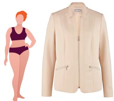
Schlicht & stilvoll: der Bequem-Blazer Bügelfrei lenkt den Blick vom Dekollete ab